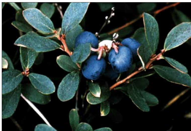
Figur 5. Mosebølle, Vaccinium uliginosum , er i Danmark kun repræsenteret med type-underarten, V. uliginosum ssp. uliginosum .

I det følgende vil vi dels støtte sprognævnets beslutning om, at