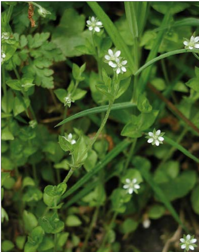
Figur 1. Skovarve, Moehringia trinervia , er blevet kaldt trenervet sandvåner, trenervet skovarve og senest almindelig skovarve, se boks 1.

videregive præcise informationer til omgivelserne har utvivlsomt haft stor betydning for overlevelse allerede for de tidligste mennesker. Det har således været af indlysende værdi at kunne meddele andre medlemmer af flokken hvilke af områdets dyr og planter, der var spiselige eller på anden måde nyttige, og hvilke, der var unyttige eller direkte livsfarlige, fx giftige. I forbindelse med navne på større dyr som fugle og pattedyr har undersøgelser vist en forbløffende overensstemmelse mellem naturfolks artsopfattelse og vores "moderne" artsopfattelse. Indlysende nok har folkelig tradition kun navne for arter eller artsgrupper, hvor der har været et behov for kommunikation. Dette behov er