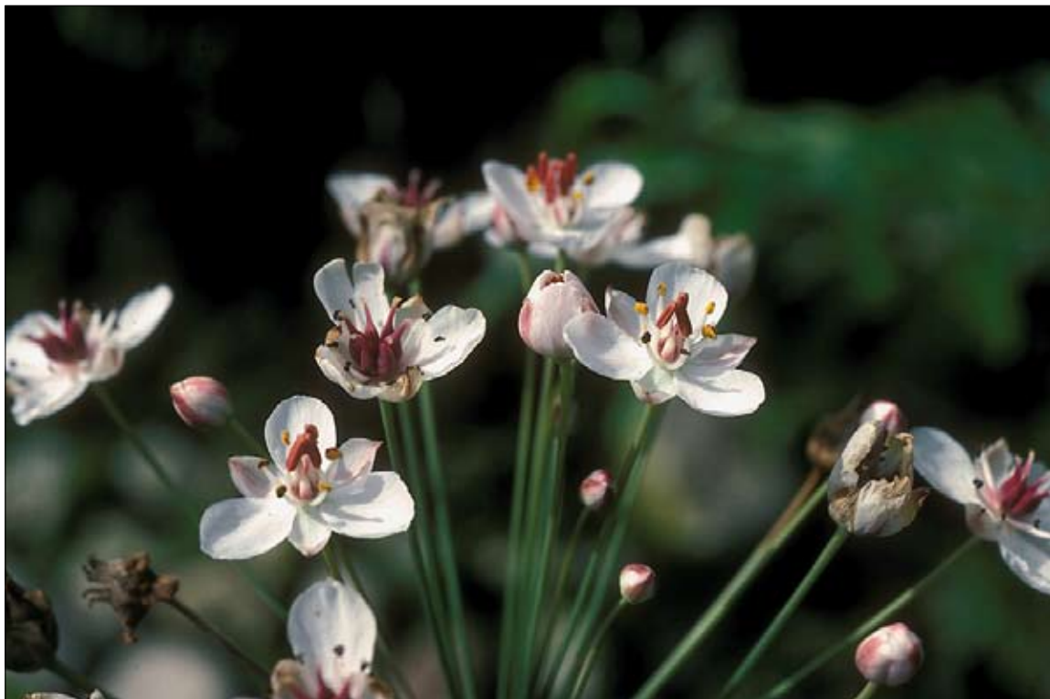
Figur 6. Brudelys er både navnet på slægten Butomus og på dens eneste art, B. umbellatus .

danske plantenavne skrives med lille begyndelsesbogstav, dels argumentere for brugen af bindestreg i artsnavne for planter og dyr.