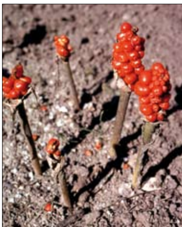
Figur 4. Slægten arum ( Arum ) og dens arter kaldes undertiden ”ingefær”, fx dansk ingefær. Sammenblandingen er uheldig, da alle dele af arum , også de iøjnefaldende bær, er giftige.

når det gælder trivialnavne, har vi dog selv i et enkelt tilfælde valgt at benytte et navn, som ikke tidligere er slået igennem i danske floraer, men som er blevet anbefalet af Nielsen og Ugelvig i ”Urt” (1986) og i ”Anbefalede plantnavne” (Jensen et al. 2003). Det drejer sig om slægten arum ( Arum ) med arterne dansk ( A. alpinum ) og plettet arum ( A. maculatum ). I Rostrups flora anvendes ligeledes slægtsnavnet arum , mens den eneste nævnte art kaldes dansk ingefær. I ”Dansk feltflora” har man i modstrid med almindelig praksis givet slægten det særdeles uheldige danske navn ingefær, og arterne kaldes henholdsvis dansk og plettet ingefær. Man kan selvfølgelig med rette hævde, at vi ved at fjerne navnet dansk ingefær for Arum alpinum afbryder en mere end 350 år gammel, traditionel brug af et artsnavn, der henviser til, at jordstænglen blev brugt som mave- medicin ligesom ægte ingefærs jordstængel. Men da de fleste mennesker i dag forbinder navnet