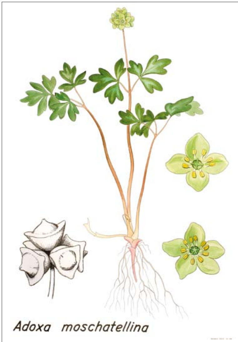
Figur 2. Desmerurt, Adoxa moschatellina , er en uanselig urt, der i nyere klassifikationer placeres i familie med arter fra Caprifoliaceae (gedebladfamilien) og Sambucaceae (hyldefamilien). Akvarel: B. Johnsen efter C. A. M. Lindman, Bilder ur Nordens Flora .

naturligvis ikke statisk, men ændrer sig med tiden.